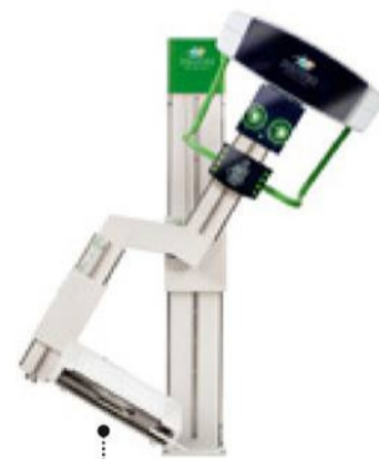
AUCH MEDIZINTECHNIK braucht eine gute Form, so wie das Röntgengerät der ID Design Agentur