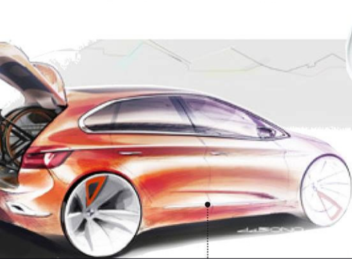
BMW UND AUDI spielen mit ihren Fahrzeugen in der internationalen Design-Top-Liga