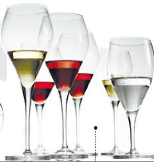
GLAS UND PORZELLAN von Schott Zwiesel bis Rosenthal sind weltweit bekannt und gefragt